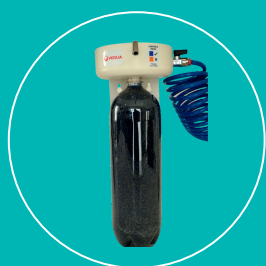
Avec équerre murale PVC de fixation